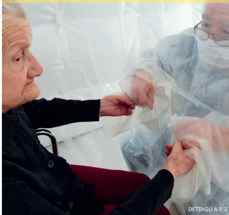
DETTAGLI A P. 2

I problemi delle rsa c'erano già prima della pandemia. Almeno 3 sono i punti da affrontare: formazione del personale, costo delle rette e implementazione dei servizi a domicilio.